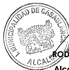
RODRIGO MARTINEZ ROCA Alcalde de Casablanca